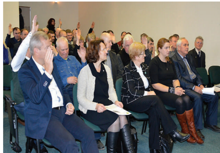
LAS Šakių r. agronomų asociacijos ataskaitinė konferencija. Jos metu agronomai išgirdo LAMMC Joniškėlio bandymų stoties mokslininkų rekomendacijas. 2016