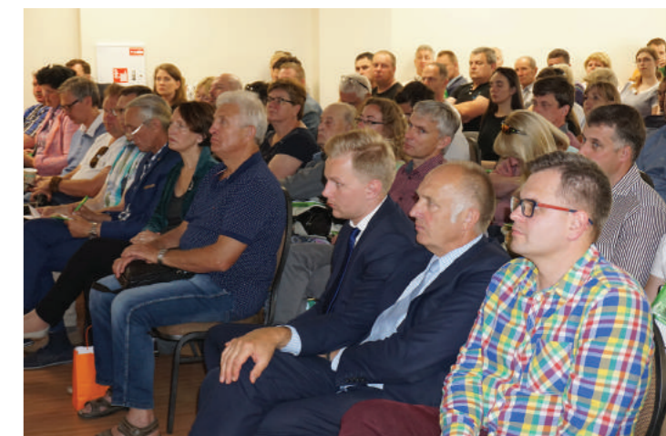
Itin vertingi mokslo ir gamybos atstovų pranešimai apie inovatyvias technologijas, užtikrinančias agroekosistemų tvarumą. 2017