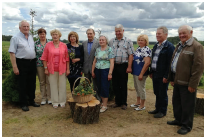
Pirmieji edukacinės vaistažolių programos svečiai – Varėnos r. skyriaus agronomai. 2017