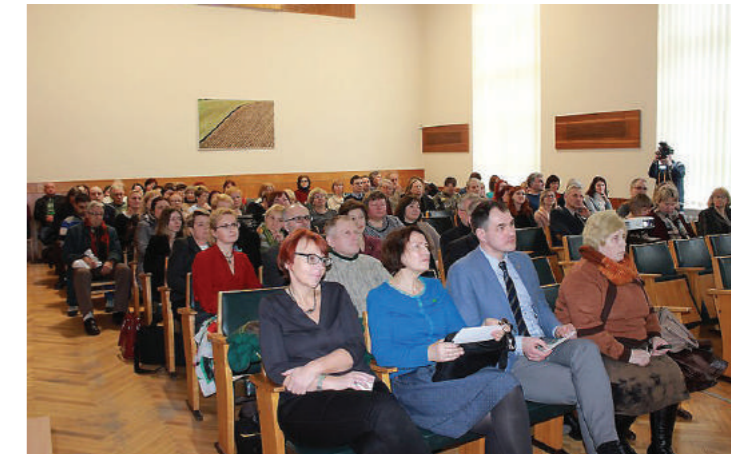
Kaip ir kasmet, Žemės dienos renginyje buvo diskutuota aktualiomis temomis. 2017