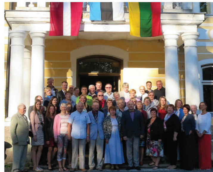
Kasmetinė tarptautinė agronomų stovykla Estijoje, Rapla rajone. Tradicija gyvuoja nuo 1989 m., kasmet paeilui susitikimą organizuoja Piarnų ir Raplo rajonų (Estija), Kuldygos (Latvija) ir Šiaulių bei Radviliškio agronomai. 2016