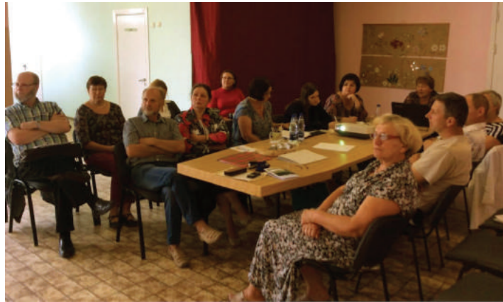
Svečiuose vedantieji šalies ekologai-mokslininkai. 2016