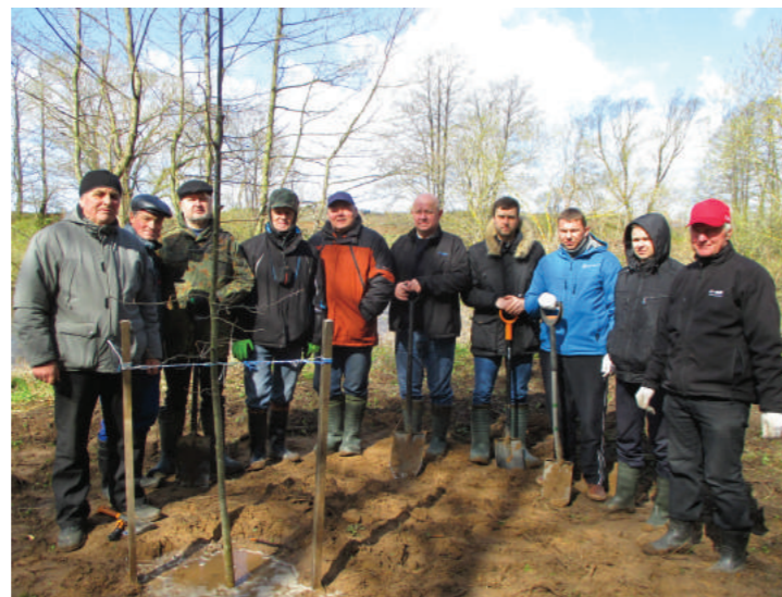
Agronomų pavasarinė talka prie Šešupės. Pasodintas Agronomų gžuolynas. 2017