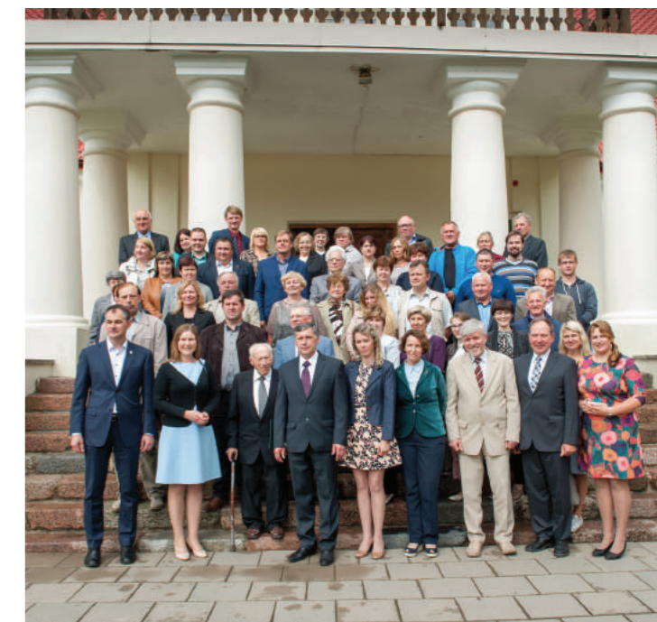
Pasvalio rajono agronomų bendruomenė ir svečiai, susirinkę LAMMC Joniškėlio bandymų stoties 90-mečio proga. 2017