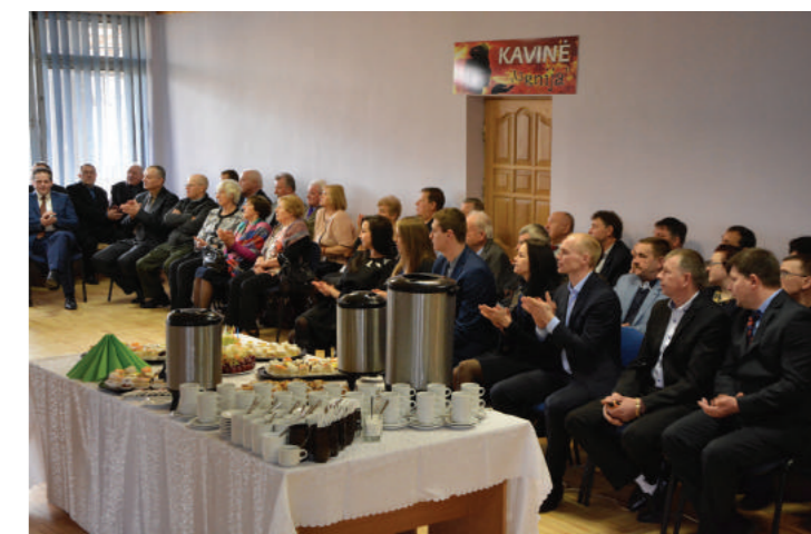
Šilalės r. agronomų susirinkimas – visada šventė, kurioje gausu dalyvių, svečių. 2017