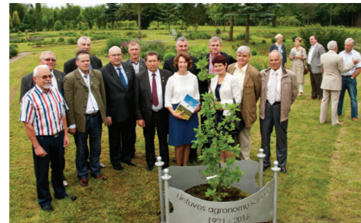
Šilutės ir Šilalės r. agronomai LAS XXX suvažiavime. 2016